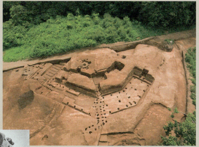
照空中隊本部跡の遺構群

平成29年12月～令和2年3月にかけて、横浜市戸塚区の舞岡熊之堂遺跡で発掘調査が行われ、太平洋戦争末期の照空隊陣地跡が良好な状態で発掘されました。本展示は発掘された各遺構を解説するとともに、豊富な図面や写真を掲示して、太平洋戦争時の照空隊の実態に迫ります。